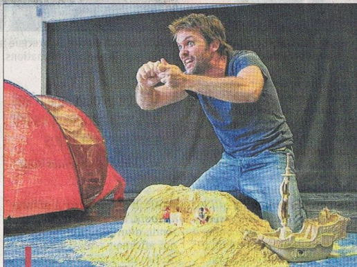
L'Odyssée pour 2 comédiens, un bac à sable et une tente Quechua.

taclé, et on oublie les jouets, c'est Ulysse lui-même qui évolue devant nous avec ses potes marins.